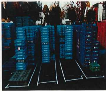
コンテナ置き場の区画