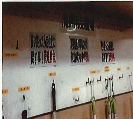
清掃用具の整頓(見える化)