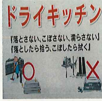
掲示、朝礼での周知