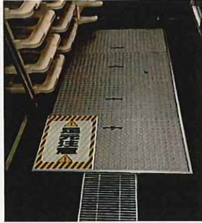
すべりやすい箇所表示