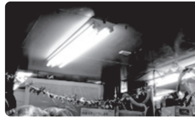
工事前（薄暗い部分もありました）