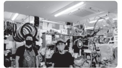
工事後（店全体が明るく快適に）