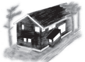
補助金活用後のイメージ

事業再構築の具体的な内容 サービス業（建設業に付随する建物のクリーニング養生等）から、小売業アンティーク雑貨家具の店舗販売を事業として計画。また将来的には、ネット販売、雑貨全般のコーディネート提案発信、雑貨にまつわるワークショップの開催、食器を使った生け花や料理、金継ぎ教室を行う計画。